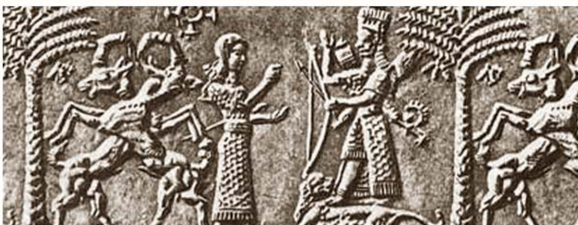
Сцена поклонения богине Нинхурсаг. Оттиск печати ассирийского времени. 1-я половина 1 тыс. до н.э.

И сотворил бог Энки Дильмун – «чистую», «непорочную» и «светлую» «страну жизни», которой неведомы были болезни и смерть. Призывает Энки Уту, бога солнца, и приказывает ему наполнить Дильмун свежей водой, принесенной с земли. Уту выполняет приказание, и страна превращается в божественный сад с плодоносными зелеными лугами и долинами.