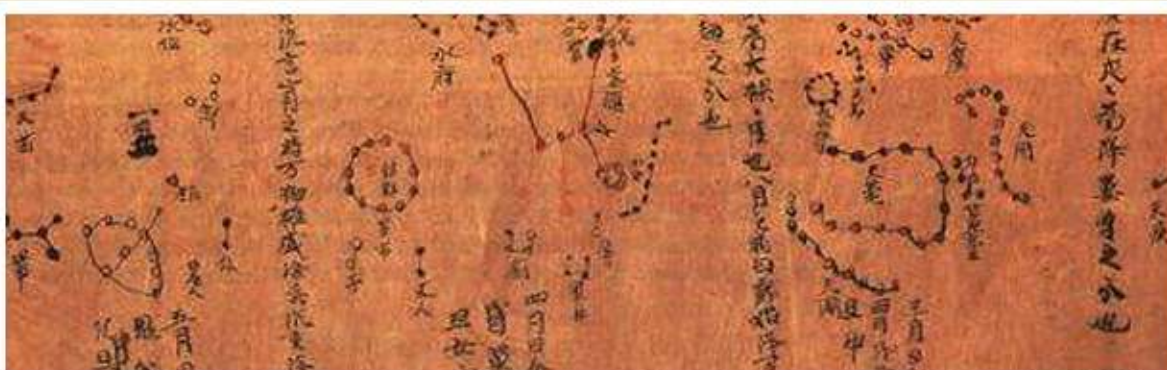
Китайская звездная карта 940 г. из Дуньхуана, нарисованная в проекции Меркатора.

Существует множество версий этого мифа, различия касаются того, во что превратились части тела великана. Порой он надеялся властью изменять погоду, которая зависела от его настроения.