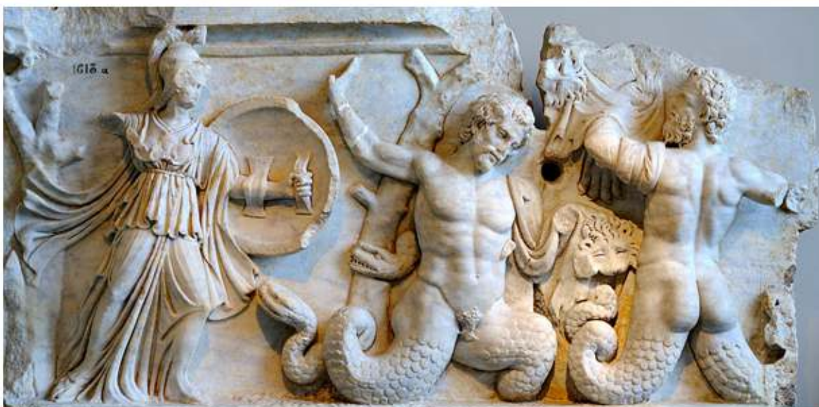
Гигантомахия - борьба Олимпийских богов с гигантами - порождениями Геи, дерзнувшими свергнуть олимпийцев.

Кроме титанов, породила могучая Земля трех великанов - циклопов с одним глазом во лбу - и трех громадных, как горы, пятидесятиголовых великанов - сторуких, названных так потому, что сто рук было у каждого из них. Против их ужасной силы ничто не может устоять, их стихийная сила не знает предела.