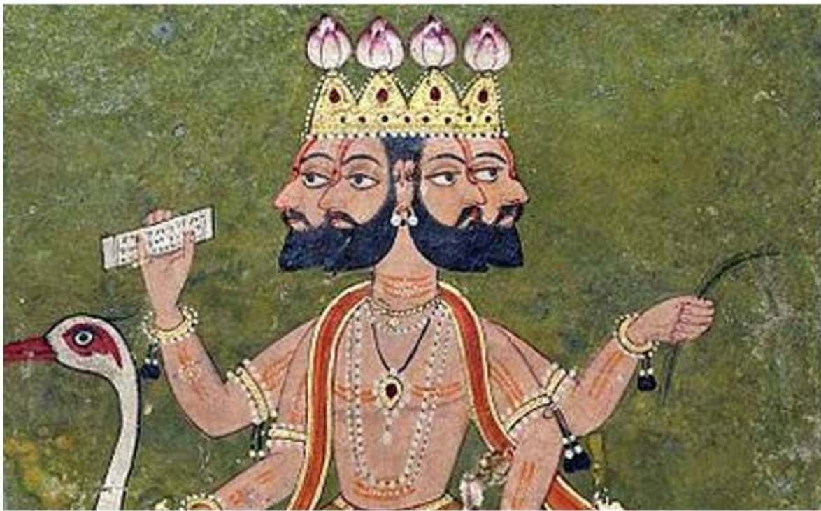
Брахма, в индуистской мифологии творец и правитель мира, отец богов и людей

Ведь Пуруша — это вселенная, которая была и которая будет. Таковы его величина и величие. Из первочеловека возникли миры: Луна родилась из его души, из глаз — солнце, из уст — Индра и Агни, из дыхания родился ветер, из пупа — воздушное пространство, из головы — небо, из ног — почва, из уха — стороны света.